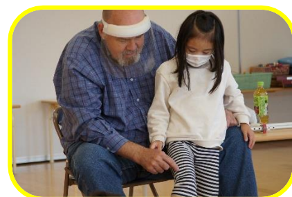
Stripu しましま模様「ストライプ」