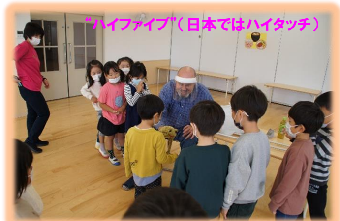
「ハイファイブ」(日本ではハイタッチ)