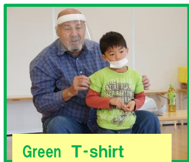
Green T-shirt 「グリーンティーシャツ」